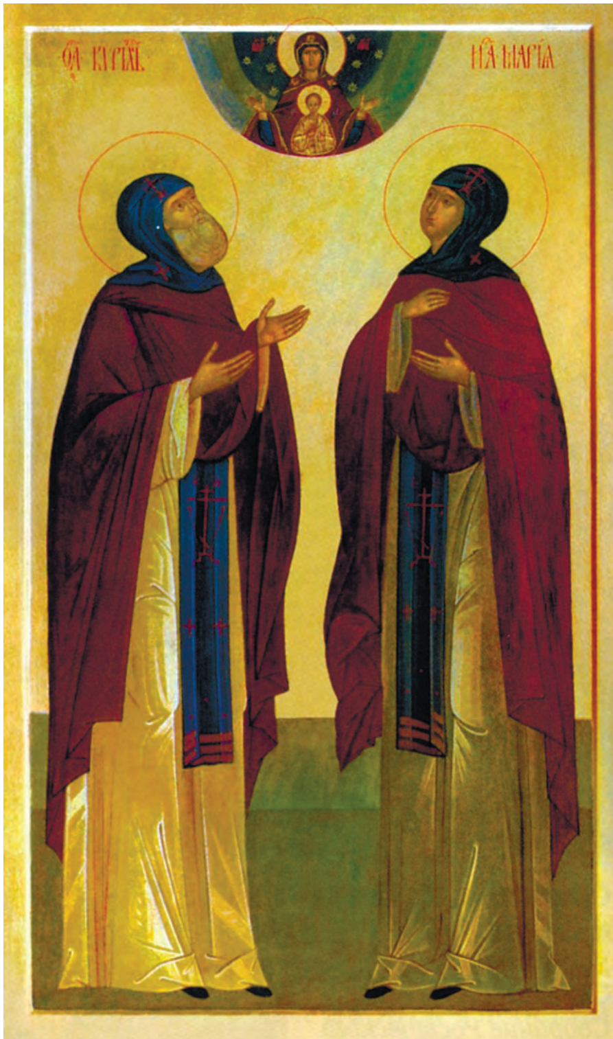
Святые Кирил и Мария Радонежские — родители преподобного Сергия Радонежского